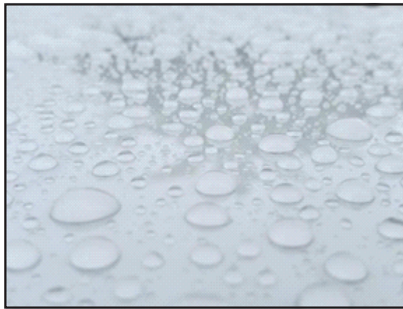
Гидрофобная поверхность (TOP-coat) LEGEND®PPF Prime Matte

Устойчивость к химикатам и окрашиванию LEGEND®PPF Prime Matte является результатом тщательного подбора компонентов формулы защитного слоя TOP-coat . Впервые в этом продукте инженеры и технологи смогли совместить высокую эластичность с повышенной химстойкостью! Этого давно ждали дилеры-установщики и владельцы ТС.