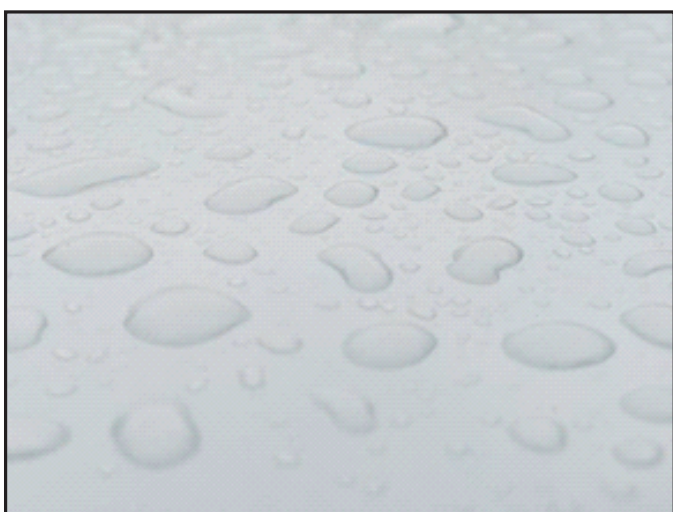
Обычный уретановый слой (TOP-coat)