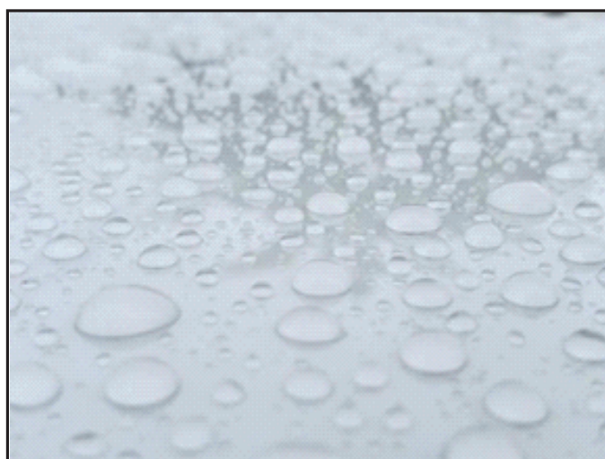
LEGEND®PPF Prime Plus

Устойчивость к химикатам и окрашиванию LEGEND®PPF Prime Plus является результатом тщательного подбора компонентов формулы защитного слоя TOP-coat . Впервые в этом продукте инженеры и технологи смогли совместить высокую эластичность с повышенной химстойкостью!